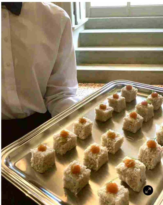
Focaccia al vapore con cuore agrodolce by chef Cracco.